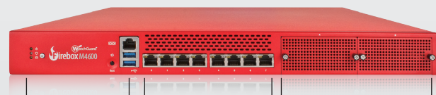
LED指示燈 USBs 網路介面 8 x 1Gb 2個自定模組擴充槽