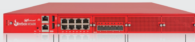
LED指示燈 USBs 網路介面 8 x 1Gb 與 4 x 10 Gb 2個自定模組擴充槽